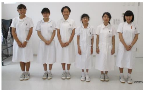
▲ 信濃中学校 学生6名