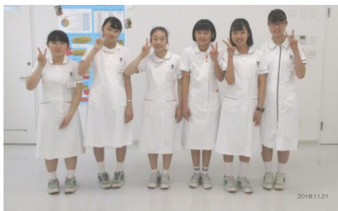
▲ 厚別南中学校 学生6名

当院では、職場体験学習の一環として、中学生の看護体験の受け入れを行っております。昨年は、中学生12名が実際に、看護師の白衣を着て1日看護体験を行いました。また、今年1月には、札幌医科大学医学部の学生3名も看護現場に入り1日体験を行いました。